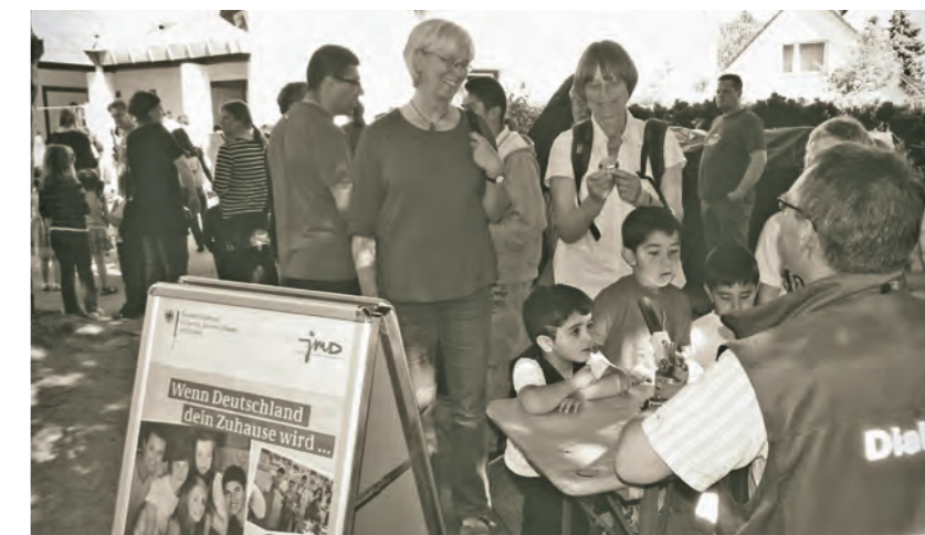
Buttonstand des JMD auf dem Sommerfest des Interkulturellen und interreligiösen Projekts Anversus-Haus Lübeck, 2012

Obwohl die Zahl der beratenen Klienten gegenüber dem Vorjahr von 192 auf 133 zurückgegangen ist, ist die Zahl der Beratungskontakte (rd. 1000) dabei nahezu konstant geblieben. Das bedeutet, dass 2011 deutlich mehr Zeit pro Klient/in aufgewendet werden musste als 2010.