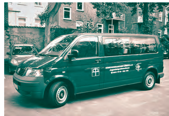
Der Bully des JMD

Die Kürzung der Landesmittel für die Migrationssozialberatung in Lübeck führt zum Wegfall der einzigen russischsprachigen Beraterin bei der Gemeindediakonie. Über diese hatte auch der JM laufend Zugang zu Jugendlichen aus dem russischen Sprachraum