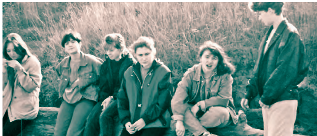
Mädchen-Freizeit Brodten/Lübeck-Travemünde 1995