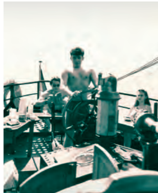
Segeltörn 1991 mit Aussiedler/innen und einheimischen Jugendlichen in der "Dänischen Südsee"