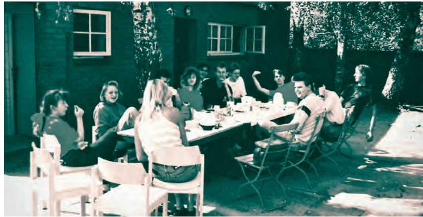
Wochenendfreizeit 1990 im Jugendheim "Klein Grönau", mit jugendlichen Aussiedler/innen aus Polen