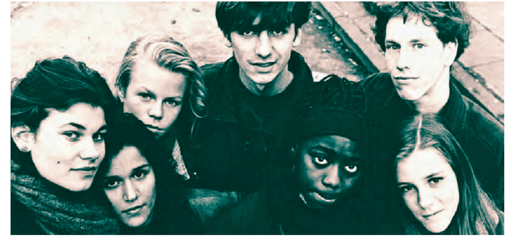
Plakatmotiv der Ausstellung "anders? cool!"