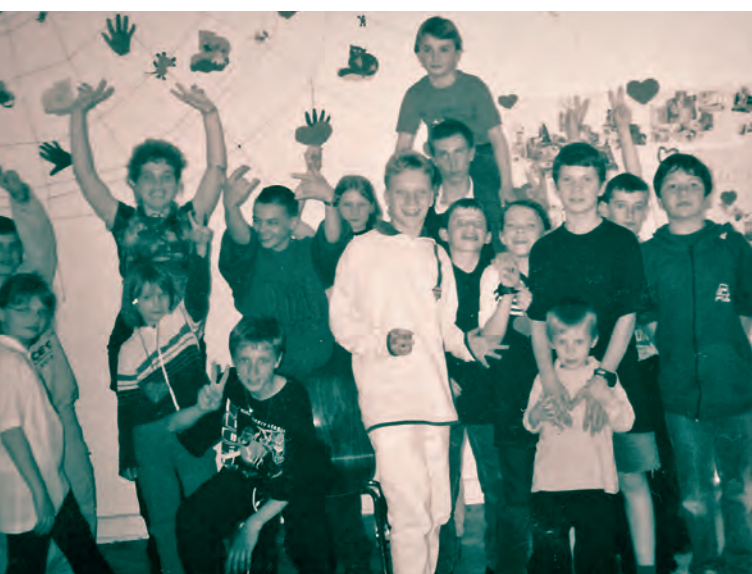
Musik- und Theatergruppe in der Gemeinschaftsunterkunft für Aussiedler, Steinrader Weg, 1998 – 2004