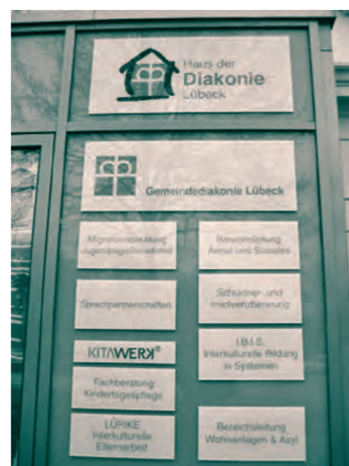
Schilderwand am Haus der Diakonie