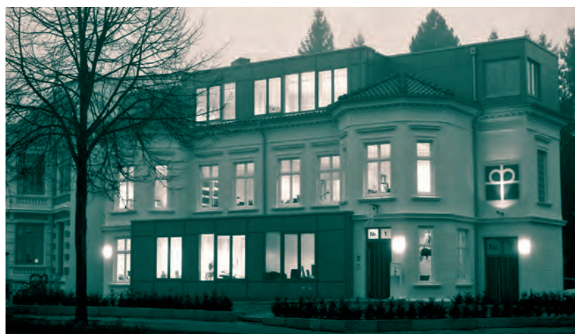
2008: Umzug aus der Kirchenkanzlei Bäckerstraße in das Haus der Diakonie am Mühlentorplatz