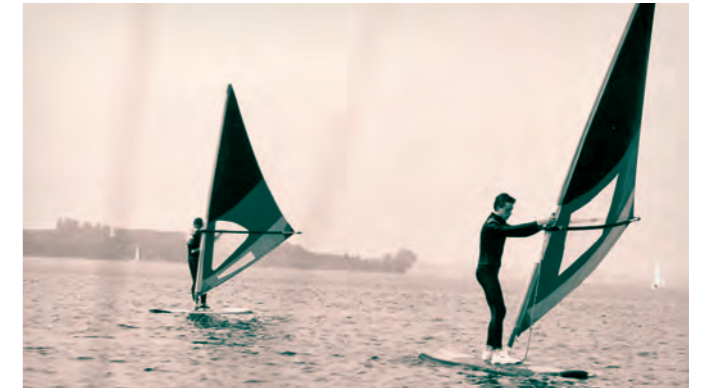
Segel- und Surffreizeit im CVJM-Segelsportzentrum am Ratzeburger See 1998

Das Interkulturelle Netzwerk als Projekt des JGW legt den Grundstein für eine umfangreiche Netzwerk- und Gremienarbeit