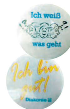
Selbstproduzierte Buttons, 2012

Erste Kontakte mit der Vorwerker Diakonie bzgl. Unterstützung bei unbegleiteten minderjährigen Flüchtlingen und verstärkter Zulauf von jungen Flüchtlingen bei Beendigung der Jugendhilfe-Unterbringung und humanitärer Flüchtlingsanerkennung