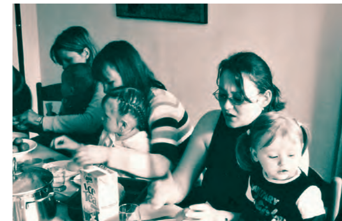
(Mutter-Kind-Gruppe im Marli-Forum, Wohngebiet Lübeck-Waldersee, 1998 – 2007